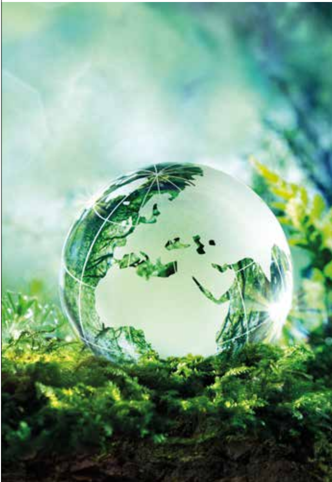
BEURSJAAR 2017: DUURZAAMHEID EN EUROPA CENTRAAL