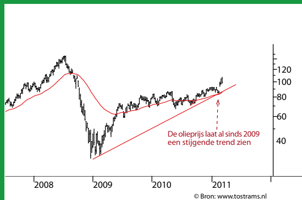
RUWE OLIE (NYMEX)

Het technische langetermijnplaatje van de Japanse beurs (Nikkei 225-index) laat al sinds begin 2010 een zijwaarts koersverloop zien. De Nikkei-index heeft de herstelfase, die medio 2010 startte, naar onderen verlaten en daarmee is het beeld licht verzwakt. Voorlopig houden we rekening met een neutraal koersverloop tussen steun 8.796,45 (gevormd op 3 september 2010) en weerstand 11.408,17 (gevormd op 9 april 2010). Een uitbraak buiten deze bandbreedte zal de nieuwe richting bepalen. Het 200-daags voortschrijdend gemiddelde van de Nikkei 225-index draait neerwaarts. Dit bevestigt de verslechtering in de technische conditie van de Japanse beurs. Wij adviseren ten aanzien van Japan aan de zijlijn te blijven.