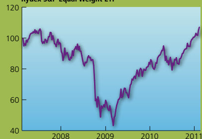
Rydex S&P Equal Weight ETF

De Rydex S&P 500 Equal Weight-tracker volgt de gelijkgewogen S&P 500 Index. Deze index bestaat uit dezelfde namen als de S&P 500. Gewichten van de onderliggende aandelen in de index worden elk kwartaal herwogen, zodat elk aandeel aan het begin van het kwartaal een weging van 0,2 procent heeft.