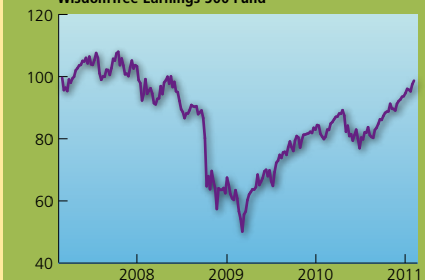
WisdomTree Earnings 500 Fund

Het WisdomTree Earnings 500 Fund is een tracker die een fundamenteel gewogen index volgt. De onderliggende index, de WisdomTree Earnings 500, kent gewichten naar rato van de inkomsten (geschoond voor incidentele baten en lasten) van bedrijven. Jaarlijks worden de gewichten van onderliggende aandelen in de index herwogen naar hun fundamentele gewicht: hierbij worden de inkomsten van de laatste vier fiscale kwartalen van een onderneming bij elkaar opgeteld. Hoe hoger de optelsom ten opzichte van alle inkomsten van de bedrijven in de index, hoe hoger het gewicht van de onderneming in de index. De onderliggende bedrijven zijn de vijfhonderd grootste bedrijven (naar marktwaarde). Net als bij de iShares S&P 500-tracker is er een forse concentratie in de portefeuille, de top-10 is goed voor 23 procent.