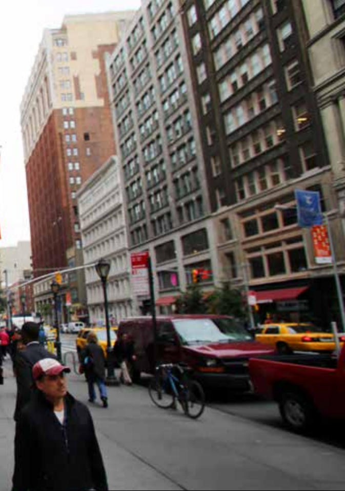
THE HOME DEPOT IS EEN UITBLINKER WAT BETREFT ESG-FACTOREN IN DE CYCLISCHE CONSUMENTENGOEDERENSECTOR EN IS EEN RELATIEF GROTE POSITIE IN VEEL VAN DE DUURZAME ETF'S.