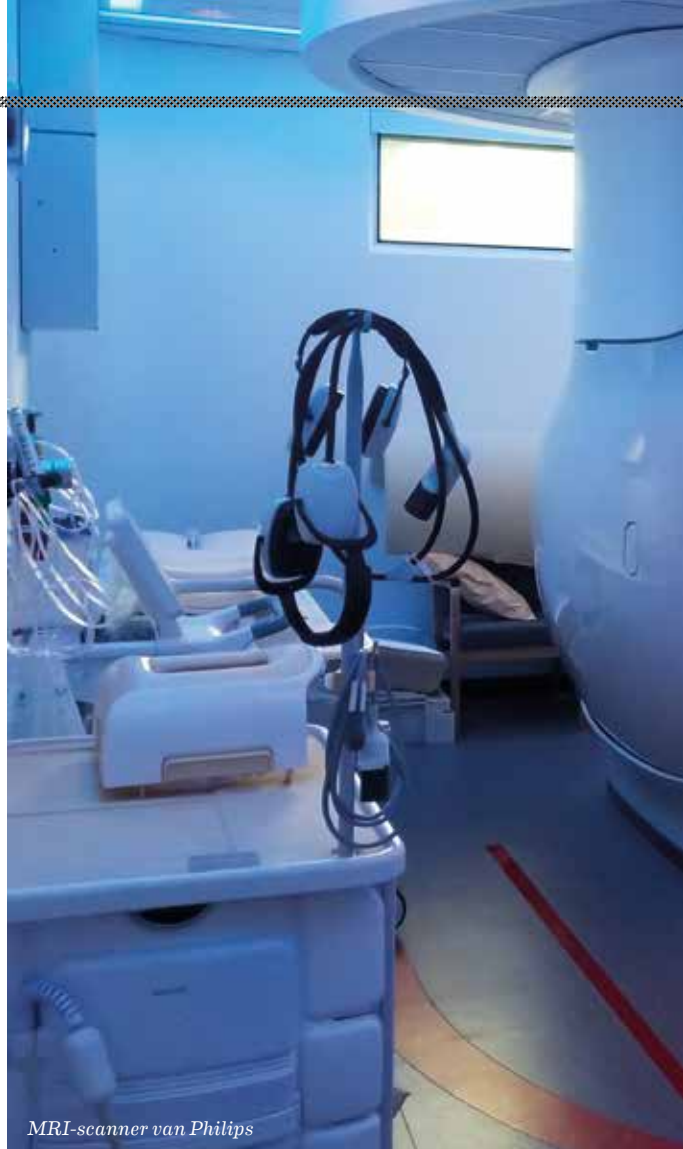
MRI-scanner van Philips

Fresenius is daarnaast met een marktaandeel van 34 procent ook wereldwijd de grootste op de markt voor dialyse-apparatuur. De ontwikkeling, fabricage en verkoop is goed voor 'slechts' zo'n 20 procent van de omzet, maar in deze tak van sport worden hoge rendementen behaald. Fresenius Medical Care lijkt te werken met