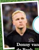
Donny van de Beek