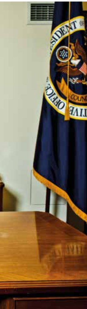
Tussen 2009 en 2011 was Austan Goolsbee de belangrijkste economisch adviseur van president Barack Obama.